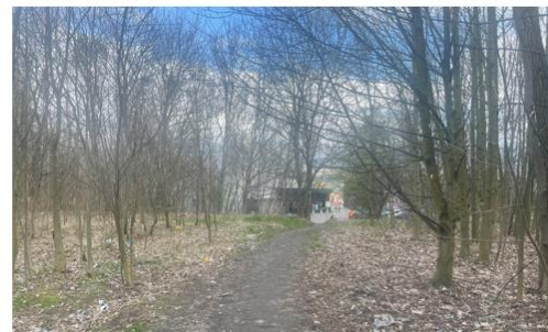
Stan działki 1544/40, ar. 2, ob. Orzegów na kwiecień 2024 r.